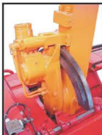
Ajuste hidráulico do ângulo de corte Leitura digital com encoder *Opcional