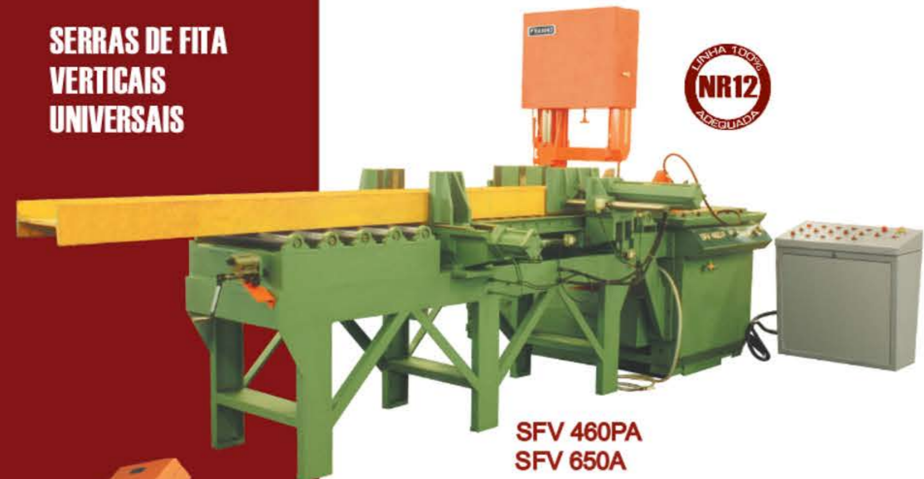
SFV 460PA SFV 650A