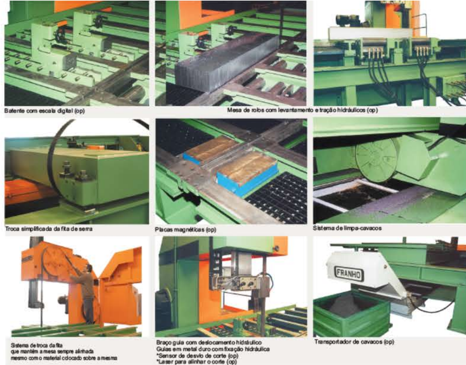
Balante com escala digital (op)

SFVB 450x660 Capacidade de corte (mm) Altura 450 Profundidade da garganta 660 Comprimento 3000 a 7000