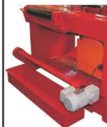
Transportador de cavacos motorizado *Opcional

As serras verticais da série SFV são dotadas de exclusivo sistema de corte com força constante, ideal para o corte de vigas e perfis, com grande variação da seção de corte. Com isso, a velocidade de avanço aumenta ou diminui em função da seção a ser cortada, conferindo grande produtividade e durabilidade da ferramenta.