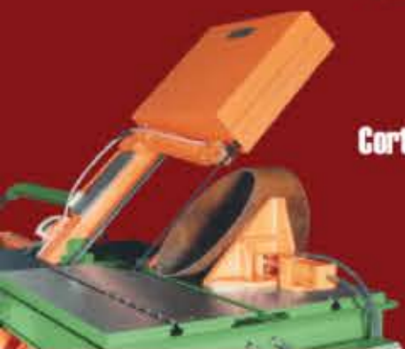
Corte de tubos