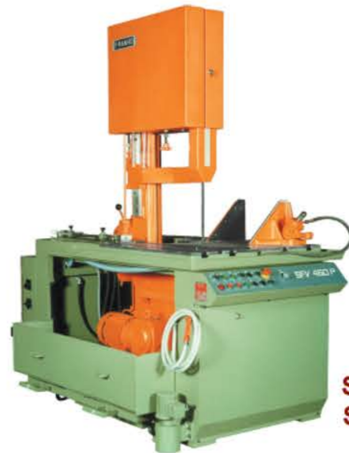
SFV 460P SFV 650