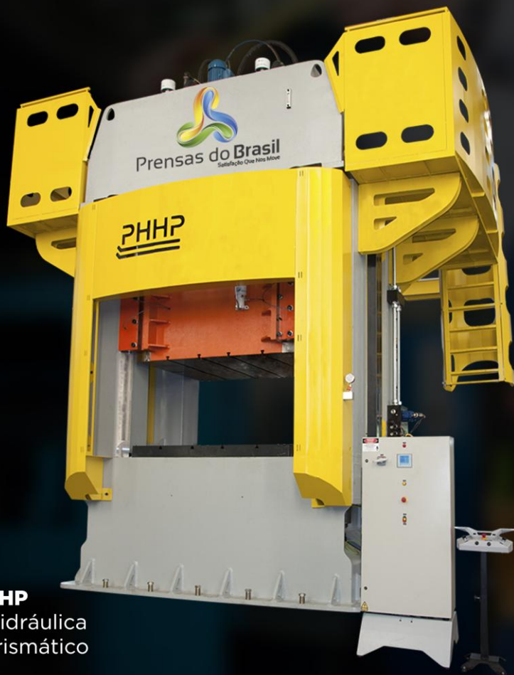
PPHP Prensa Hidráulica Tipo H Prismático

Uma ótima opção para serviços pesados que exijam máquinas robustas, grandes e precisas. O martelo flutuante é guiado por um sistema prismático e apresenta baixo atrito. Essas máquinas apresentam altíssima qualidade tecnológica e são indicadas para trabalhos como estamparia de peças automotivas e forjamento, podendo ainda vir com a opção de aquecimento.