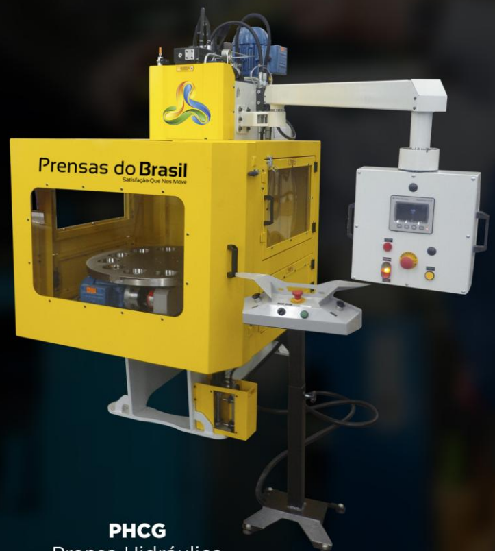
PHCG Prensa Hidráulica Tipo C Giratória

Além disso, a alimentação é feita pelo lado externo à área de prensagem, garantindo segurança ao operador da máquina. Este tipo de equipamento é indicado para montagens, corte, dobra, repuxo, rebarbação e muito mais.