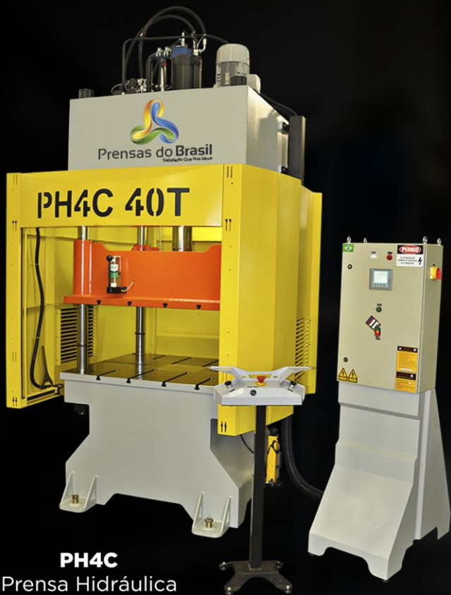
PH4C Prensa Hidráulica 4 Colunas