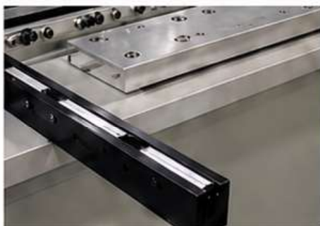
➤ Guia de Esquadro