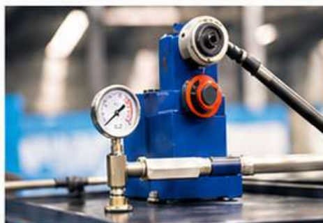
➤ Sistema Hidráulico Bosch