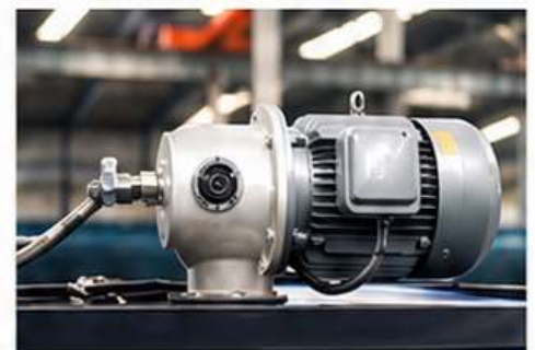
➤ Bomba de Baixo Ruído